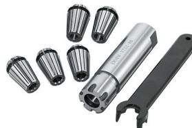
Sada kleštin 3-7 mm/5ks + adaptér

Objednací číslo 8309006 Cena bez DPH 4 190 Kč Cena s DPH 5 070 Kč