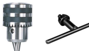
metalkraft Skličidlo 1 - 16 mm a klíč

Objednací číslo 3876007 Cena bez DPH 1 299 Kč Cena s DPH 1 572 Kč