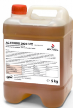
Chladicí kapalina AG FRIGUO 2000 DFX, 5 kg

Objednávací číslo 3850010 Cena bez DPH 1 239 Kč Cena s DPH 1 499 Kč