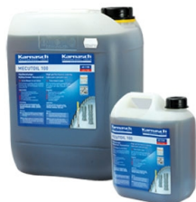
Karnasdi™ PROFESSIONAL TOOLS MECUTOIL 100 (2,5 kg)

Objednací číslo 1011 Cena bez DPH 1 099 Kč Cena s DPH 1 330 Kč