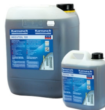
Karnasdi™ PROFESSIONAL TOOLS MECUTOIL 100, 10 kg

Objednací číslo 38760.110025 Cena bez DPH 869 Kč Cena s DPH 1 051 Kč